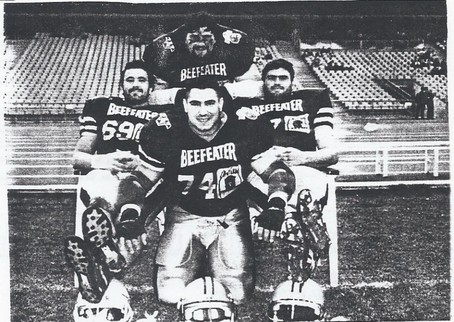
PANTERAS. UNA RAZON DE PESO.