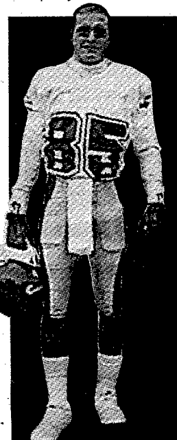
Jugador de la semana:

Falcons de Salt-Récor Pisos Imperials Domingo, Camp Municipal de Salt, 18.00 h.